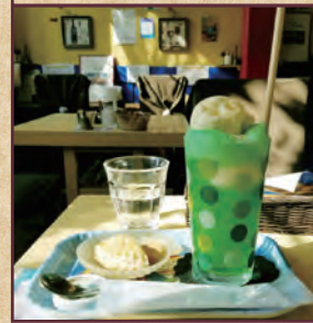
9 イーハトーブの優しい時間 板橋区蓮沼町 19-19-2