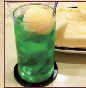
10 ティールーム コガ 板橋区本町 39-3