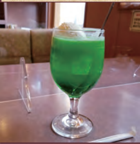
4 喫茶 K and T 板橋区蓮根 2-19-17