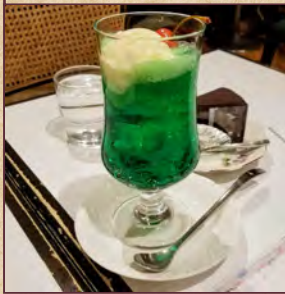
8 日島 板橋区弥生町 31-15