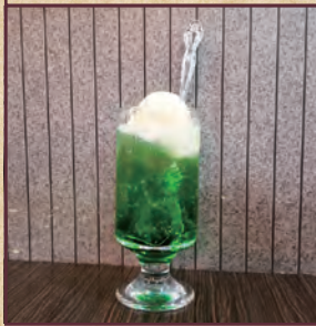
6 静 板橋区常盤台 4-30-9